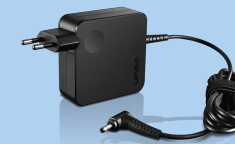
Adaptador de pared de CA de 65 W de Lenovo (UL) GX20L29355