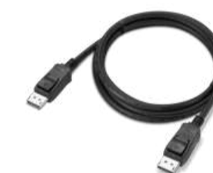
DisplayPort enovo a Cable iPlayPort 1.4 de 1,8 m