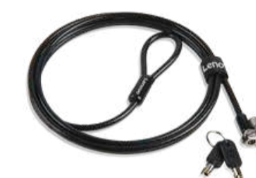
Candado para cable Kensington MicroSaver DS 2.0 de Lenovo