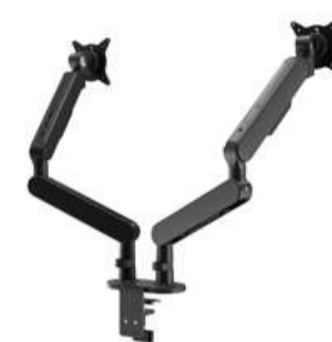
Brazo para dos monitores Exergo CTS203