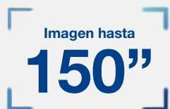
Imagen de hasta 150" en Full HD, con colores vibrantes incluso con luz ambiente.